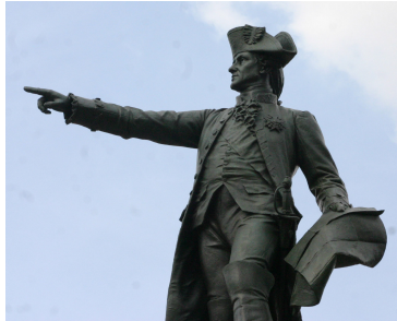
Reddition du Britannique Cornwallis , Yorktown, 1781