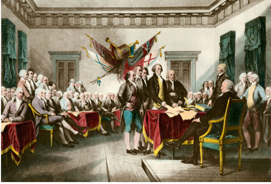
Tableau de John Trumbull représentant les signataires dont Thomas Jefferson, le principal rédacteur.